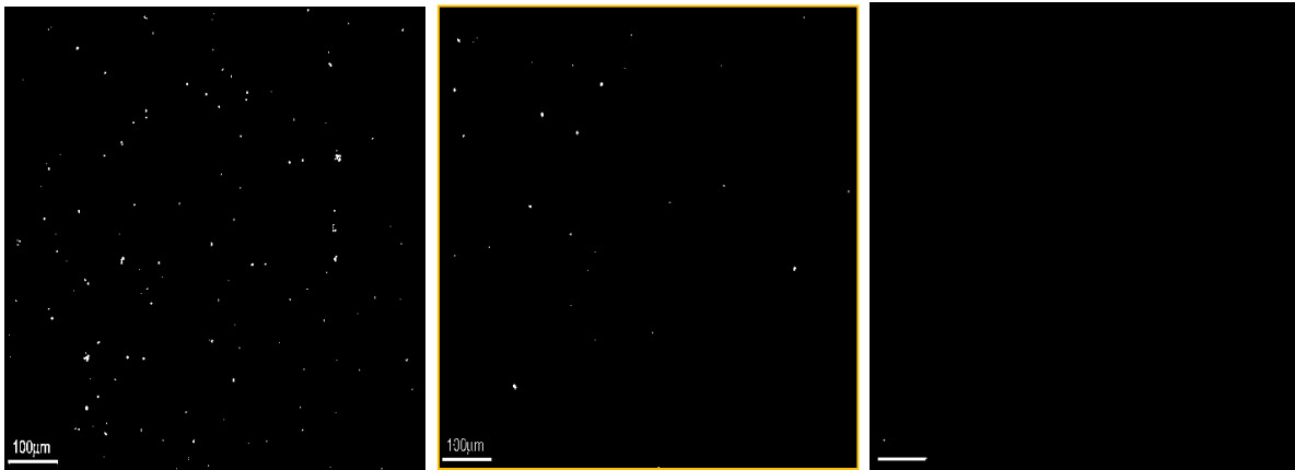
شکل ۱- سوسپانسیون مخمرهای A، B و C 10^6\% زنده، مخمرها تحت تاثیر رنگ فلوروزین دی استات به رنگ سبز درآمده‌اند. بزرگنمایی 10\times (در تصویر سیاه و سفید بصورت ذرات ریز سفید رنگ در زمینه سیاه قابل مشاهده‌اند).

میکروسکوپی به دست آمد فعالیت مخمرهای نانوایی به ترتیب از مخمر A تا مخمر C رفته رفته کمتر شد. نتایج حاصل از آزمون پخت (حجم و ارتفاع نان) دقیقاً مشابه نتایج حاصل از دو آزمون قبلی به دست آمد. در زیر ارتفاع نان‌های حاصل از سه تیمار مورد آزمون با هم مقایسه شده اند. همانگونه که از جدول ۴ مشخص است ارتفاع نان حاصل از مخمر A بیشترین میزان و ارتفاع نان حاصل از مخمر C کمترین میزان است. این امر به دلیل تعداد بیشتر سلول‌های زنده و فعال در مخمر A نسبت به مخمر B و نیز مخمر C می‌باشد.